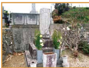
極楽寺 徳川秀忠の拝み墓

長安院跡には歴代藩主の分霊墓があります。現在、本堂は三隅町の龍雲寺に移築されています。