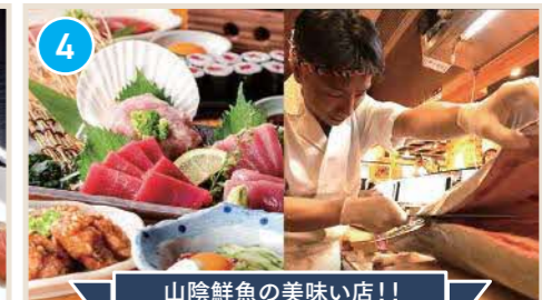
山陰鮮魚の美味しい店!!

はまごちポイント 人気海鮮専門店「ぐっさん」の2号店。旬魚やのどぐろなどその日揚げた浜田の港の味をお届け! 鮮魚以外の定食や井もおすすめ。