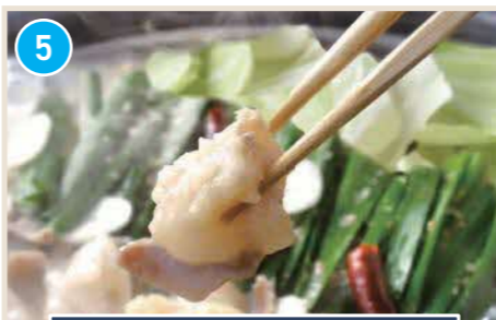
新鮮な鮭、サーモン等の海鮮料理と自慢のもつ鍋

はまごちポイント 和の空間を楽しむ洋食レストラン。落ち着いた店内で地元食材の創作料理が味わえます。ランチコースやディナー飲み放題プランもご用意。