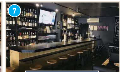
気軽にお酒が楽しめるお店!

はまごちポイント 名物のどぐろ。地酒各種取り揃えております! 日本海の赤い宝石「のどぐろ」、イカのトロと呼ばれることもある「白イカ」、大山鶏、赤てん、しじみ、ハタハタなど!