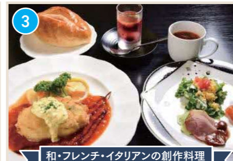
和・フレンチ・イタリアンの創作料理

はまごちポイント 名物「のどぐろめし」をはじめ地元食材の逸品多数! 浜田港でとれる地魚や郷土の味「赤てん」も。個室完備◎気軽に飲み会や食事にも最適!