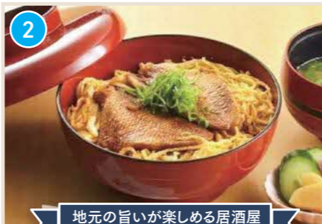
地元の旨い楽しめる居酒屋