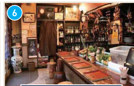
大人の雰囲気・歴史のある居酒屋

はまごちポイント 当店自慢! 圧倒的存在感の3大推し料理! 豊富なドリンクとご一緒にぜひご賞味ください。お得な飲み放題プランもご用意しています!