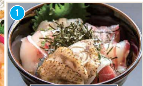
しまね海洋館アグアスの隣

はまごちポイント 長年料理人をやられている店主。こだわりの料理メニューでおもてなし。店主と気さくに会話しながらの時間をお楽しみください。