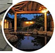
湯屋温泉は弱アルカリ性の泉質で、クレンジング効果のある美肌の湯です。

入浴時間 10:00~22:00(最終受付21:00) ※毎月第三水曜休館 料金 大人600円(税込) 小人250円(税込)