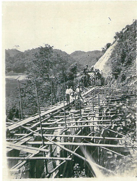
おろち泣き橋 工事現場

サミットを契機に広浜鉄道今福線の価値を発信し、皆様と一緒に広浜鉄道今福線の活用を考えていきます。