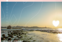
石見曇ヶ浦 (国分町)

夕日の部分がハートにくり抜かれた心（ハート）に残る美しい夕日のポストカードです。旅行から帰って地元の夕日にポストカードをかざすとくり抜かれた部分から夕日が差し込み、浜田で見た夕日を再現することができます。ポストカードと同じスポットを訪れて一緒に写真を撮ったり、家族や友人に送るのもおすすめです♡ ※ポストカードを送る場合は、定形外郵便の料金が必要です。