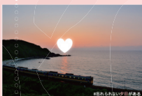
道の駅ゆうひパーク三隅 (三隅町)