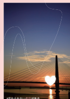
浜田マリン大橋 (瀬戸ヶ島町)