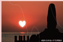
会津屋八右衛門顕徳碑 (松原町)