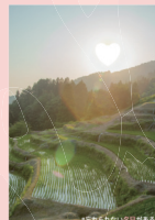
室谷の棚田 (三隅町)