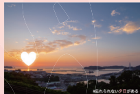
道の駅ゆうひパーク浜田 (原井町)