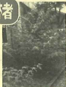
会館横の野球場側