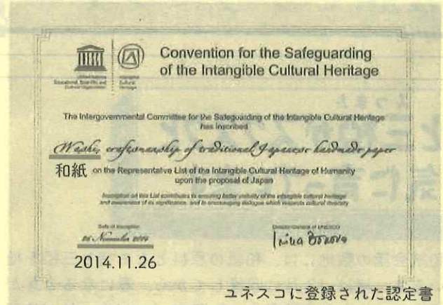
ユネスコに登録された認定書

石州半紙がユネスコ無形文化遺産に登録されて10周年になることを記念し、石州紙まつり実行委員会主催のもと(後援:浜田市、浜田市教育委員会、公財浜田市教育文化振興事業団)、「石州紙(せきしゅうかみ)まつり」が8.10(土)と8.11(日)に三隅中央会館と石州和紙会館周辺で開催されます。多くの催しが開催される予定で、三隅中央会館では、三隅町内にある4つの工房(かわひら、石州和紙久保田、西田和紙工房、西田製紙所)がブースを設置し、この2日間だけの特別価格での和紙製品の販売や、和紙・歴史的な資料・灯ろう・神楽面・神楽衣装の展示、参加者が自由に描ける和紙のアートボード、飲食コーナーなどが設置されます。また石州和紙会館では、紙漉きの実演、古式の手漉き和紙の製法が体験できるブース(無料)が設置されます。また石州和紙会館が企画する「うちわでアート!」ワークショップ(参加料300円)もこの2日間だけ開催されます。