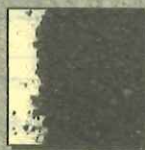
浜田市内の 小学校の岩石