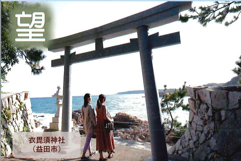
衣毘須神社 (益田市)