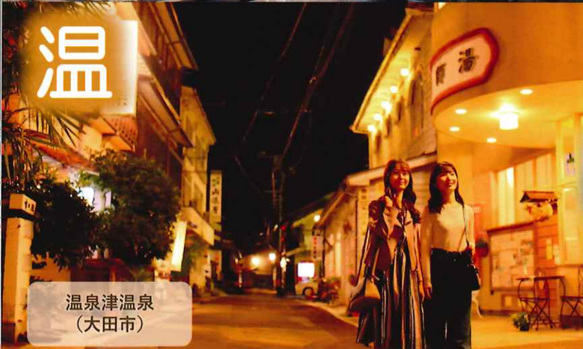
温泉津温泉 (大田市)