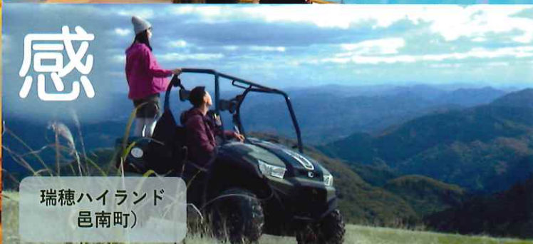
瑞穂ハイランド 邑南町)