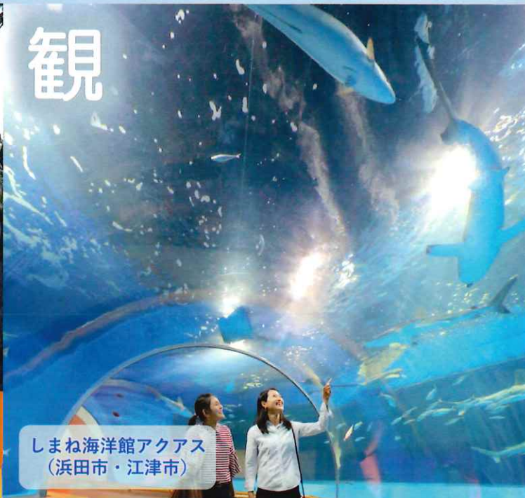
しまね海洋館アクアス (浜田市・江津市)