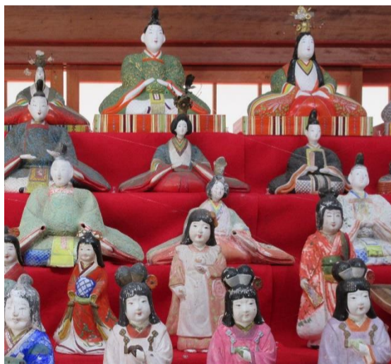
常設展示 長浜人形

今回は、浜田市以外の日本遺産・北前船寄港地として認定されている地域のなかから、北海道・東北地方12ヶ所を中心に歴史や地域の特色などをパネルで紹介していきます。