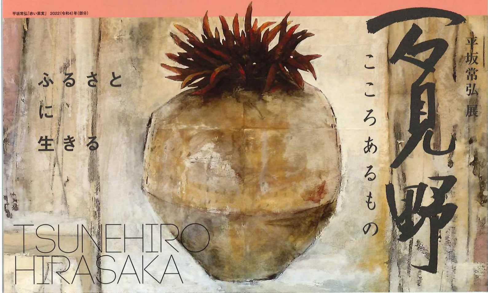
平坂常弘「赤い果実」2022(令和4)年(部分)