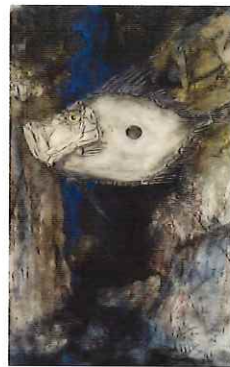
《俺のどこが悪いんだ》 2024(令和6)年

本展では、幼少期から現在に至るまで、彼が心を込めて描いてきた作品約40点を一堂にご紹介します。一人の絵描きが、故郷や石正美術館に向けてきた思いを、作品と共にご覧ください。