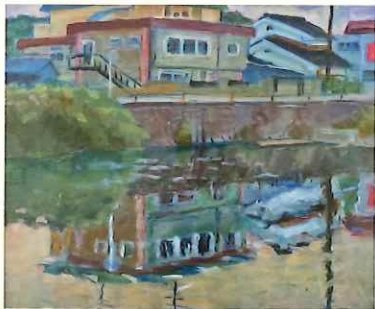
《浜田河畔》三上圭一