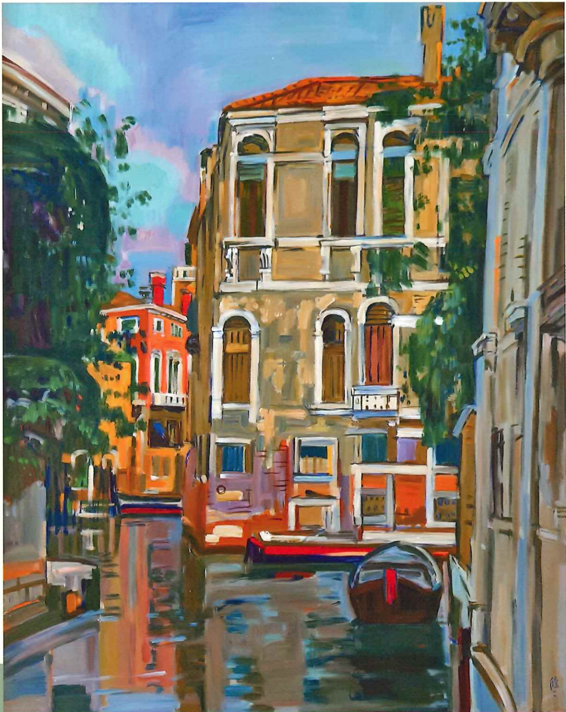
《ヴェニス残照》山崎修二