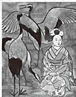
昭和44年(1969年)頃 左上/〈鶴と遊ぶ5(下絵)〉寄贈 左中/〈鶴と遊ぶ3(下絵)〉寄贈 左下/〈鶴と遊ぶ2(下絵)〉寄贈