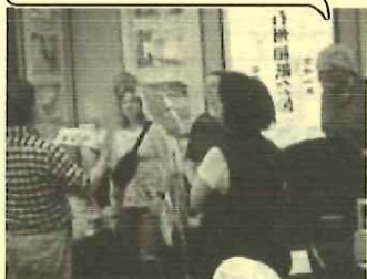
ショップでガイドから説明

『Back Roads of Japan(日本の裏道ツアー)』の中に石州和紙会館が組み込まれ、平均して月に3回程度紙漉き体験に来られています。