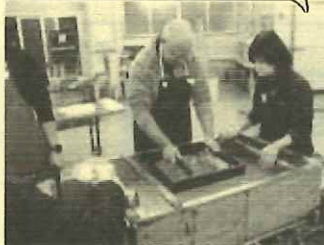
A3 サイズ紙すき体験中