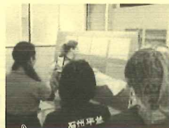
貝割り付け初体験!