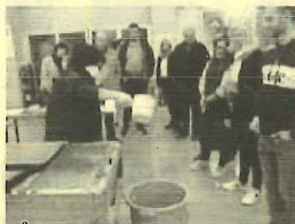
「ネリ」を初めて見て驚き