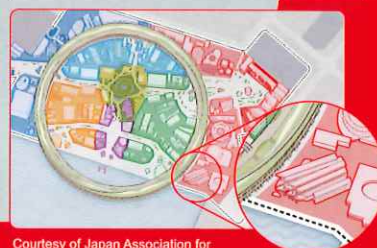
Exhibit Period August 27, 2025 (Wed) - August 31, 2025 (Sun) Exhibit Hall Gallery EAST (Yumeshima, Konohana-ku, Osaka City, Osaka Prefecture)

*Details, including exhibits and performance times, are subject to change without prior notice.